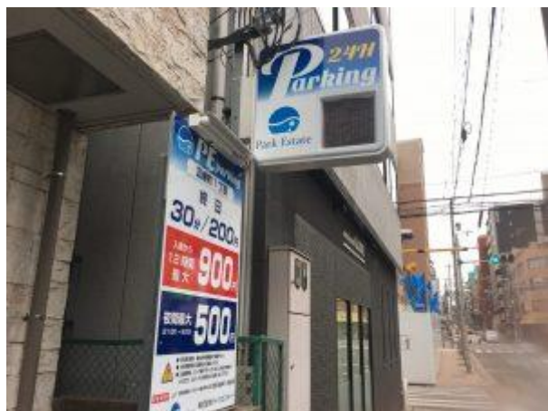
コインパーキング (ゲート・フラップ板・カメラ)

駐車場の空車室を弊社が まとめて借り上げ させていただき一定の賃料をお支払いいたします。オーナー様は新たな投資をすることなく、毎月の安定した収入アップが実現します。